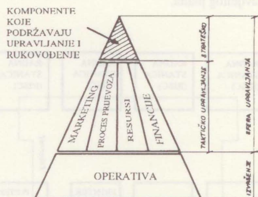
Slika 1. Mjesto informacijskih sustava u HŽP-u vezanih za strateško i taktičko upravljanje