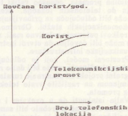
Slika 3. Korist od telekomunikacija u ruralnom prometu

Uz povećanje broja telefonskih lokacija na promatranom ruralnom područјu, povećava se i ekonomska korist, ali uvijek s usporavajućim (padajućim) intenzitetom. I telefonski promet pokazuje veliku tendenciju porasta do određenog broja lokacija, a zatim se njegovim daljnjim povećanjem usporava (sl. 3).